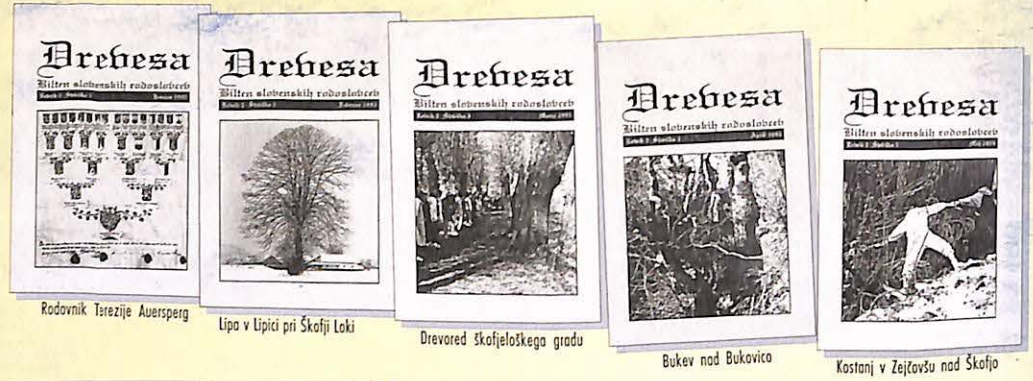
Rodovnik Terezije Auersperg