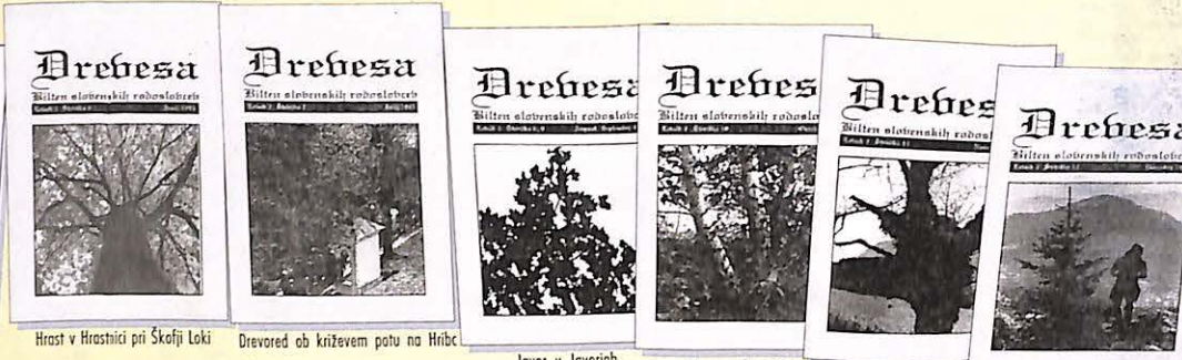
Hrast v Hrastnici pri Škofji Loki